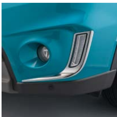
Otvor za dnevna svjetla - kromirana