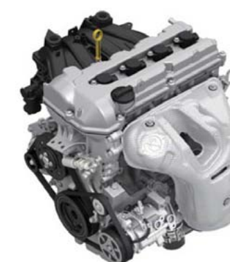
1.6 VVT Benzin - 88kW (120KS)

Najbolji pogon za vaš život, ne smijemo vas zakinuti: Vaša je ambicija i želja da donesete odluke sa dobrim krajnjim rezultatom. Ostaje samo predstaviti dvije varijante nove Suzuki Vitare sa motorima velikog okretnog momenta - jer vas oni dovode do vašeg odredišta. U ponudi je 1,6-litreni benzinski ili diesel motor 2 svaki sa 88 kW (120 KS) i maksimalnim okretnim momentom od 156 Nm kod benzinskog i 320 Nm kod diesel motora. Obje verzije dolaze sa prednjim pogonom i pogonom na sva četiri kotača s 5-stupanjskim ručnim mjenjačem (benzin) ili 6-stupanjskim ručnim mjenjačem (diesel). Obje varijante motora osiguravaju ne samo vaš užitek u vožnji, nego i nisku potrošnju goriva 1 . Najnovija tehnološka rješenja, u skladu sa laganom konstrukcijom, start-stop sustavom i sveobuhvatnim aerodinamičnim rješenjima su također odgovorni za niske emisije CO 2 . U novoj Suzuki Vitari nije samo vožnja zadovoljstvo, nego su i troškovi zadovoljavajući!