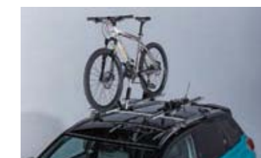
Krovni nosači sa držačem za bicikle