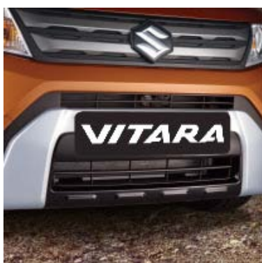
Prednji produženi branik - srebrno/crna