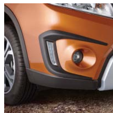
Otvor za dnevna svjetla - crna