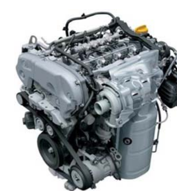
1.6 DDiS Diesel - 88kW (120KS)