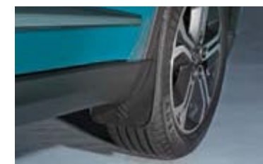
Gumene zavjesice blatobrana