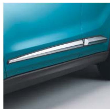
Bočna zaštita - kromirana/crna