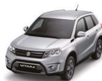
Silky Silver Metallic (ZCC)