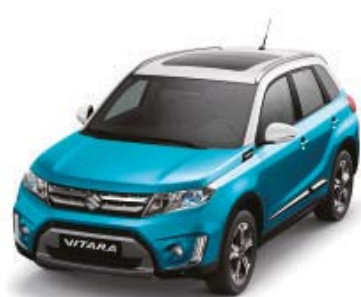
Atlantis Turquoise Pearl Metallic (ZQN), Superior White (26U)