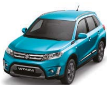
Atlantis Turquoise Pearl Metallic (ZQN)