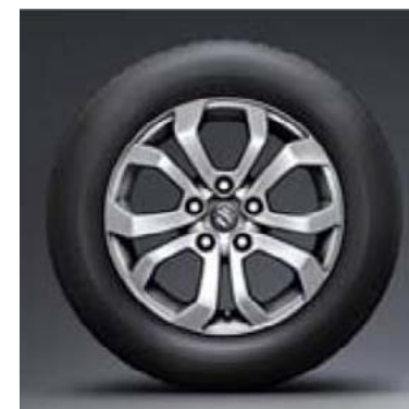
16" alu naplatak (dodatna oprema)