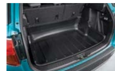
Kada za prtljažnik