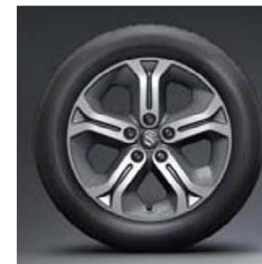
17" alu naplatak (standard za GL+)