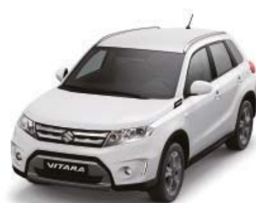
Superior White (26U)