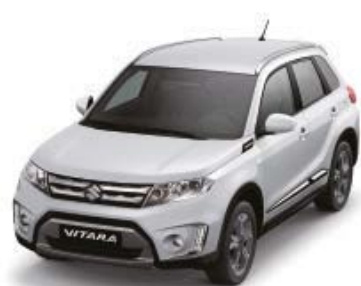
Cool White Pearl Metallic (ZNL)