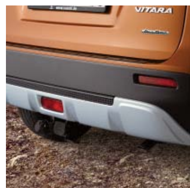
Stražnji produženi branik - srebrno/crna