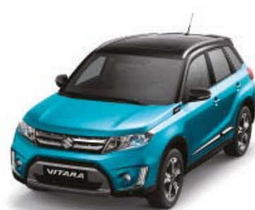
Atlantis Turquoise Pearl Metallic (ZQN), Cosmic Black Pearl Metallic (ZCE)