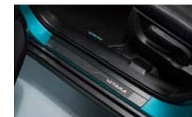
Zaštitni prag vrata