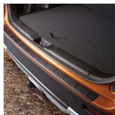
Zaštita prtljažnika - crna