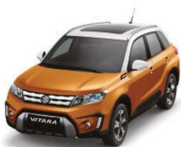
Horizon Orange Metallic (ZQP), Superior White (26U)