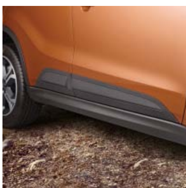
Bočna zaštita - crna