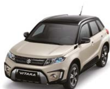
Savannah Ivory Metallic (ZQQ), Cosmic Black Pearl Metallic (ZCE)