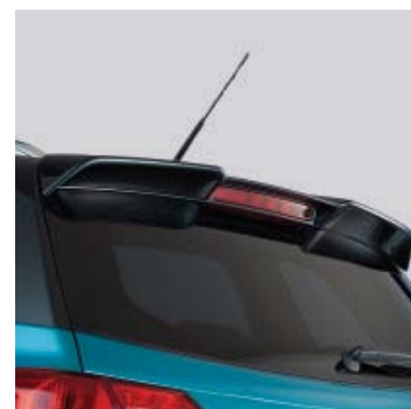
Krovni spojler - u svim bojama