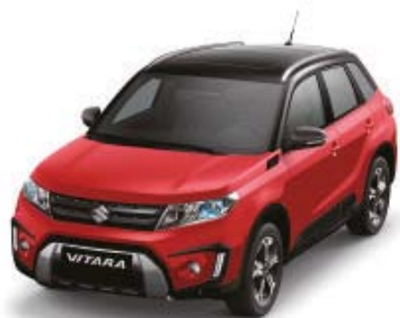
Bright Red (ZCF), Cosmic Black Pearl Metallic (ZCE)