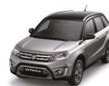
Galactic Gray Metallic (ZCD), Cosmic Black Pearl Metallic (ZCE)