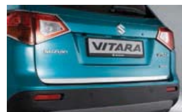
Zaštitna lajsna na stražnjim vratima