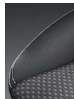
Unutrašnjost uz GL+