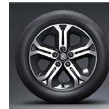
17" polirani alu naplatak (standard za GLX)