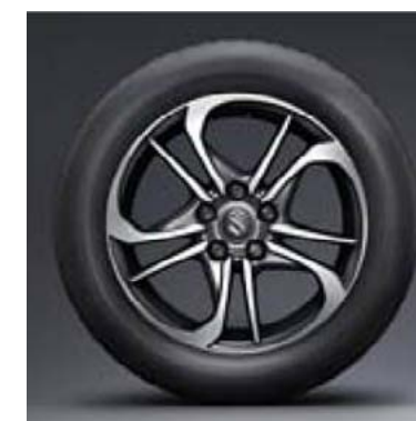
17" polirani alu naplatak (dodatna oprema)