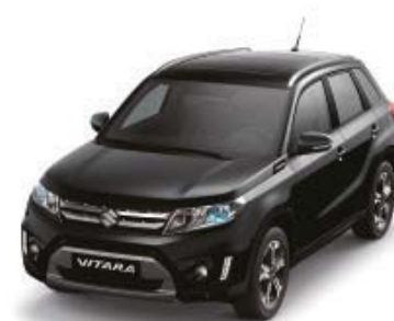
Cosmic Black Pearl Metallic (ZCE)