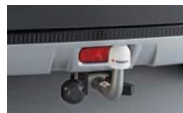
Odvojiva kuka za vuču sa električnim konektorom