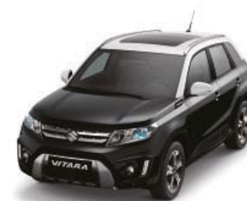
Cosmic Black Pearl Metallic (ZCE), Superior White (26U)