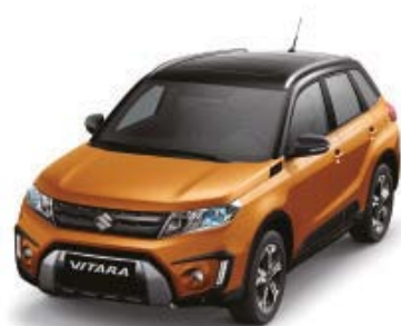
Horizon Orange Metallic (ZQP), Cosmic Black Pearl Metallic (ZCE)