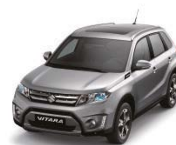
Galactic Gray Metallic (ZCD)