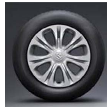
16" čelični naplatak sa pokrovom kotača (standard za GL)