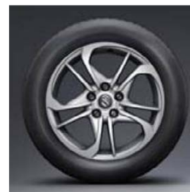
17" alu naplatak (dodatna oprema)