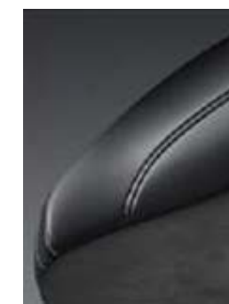
Unutrašnjost uz GLX