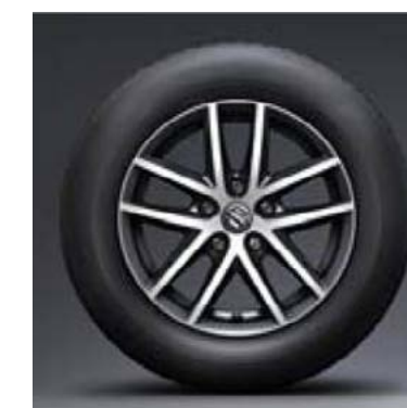
16" polirani alu naplatak (dodatna oprema)